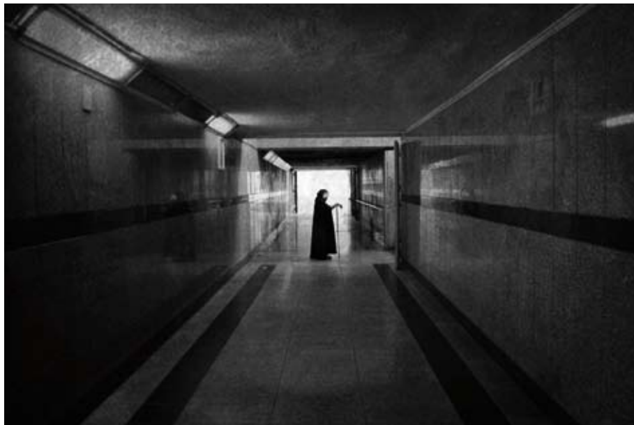
Karmil Rafael Cardone - Le muse inquietanti , 2011 - stampa lambda su MDF - cm 50 x 60