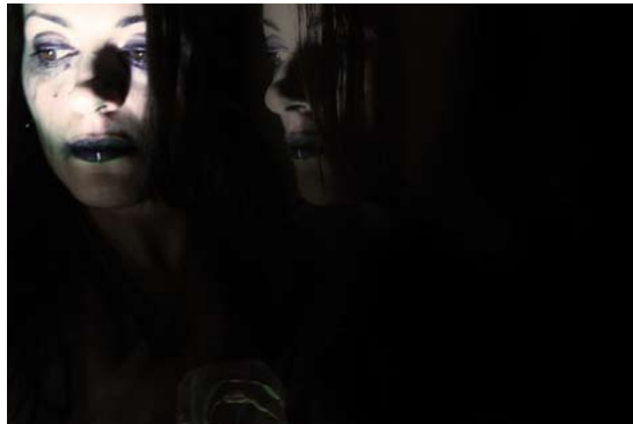
Danilo De Mitri - Anna , 2011 - stampa lambda su MDF - cm 50 x 70